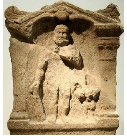
Figuur 3 Wijaltaar voor Hercules Magusanus