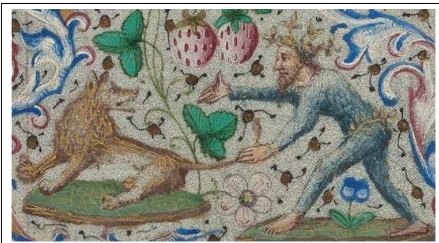
Figuur 6 afbeelding van een Wildeman die met een Leeuw in het getijdenboek van Simon de Varie ca.1450

Volgens mij is de verklaring o.a. af te lezen aan een afbeelding uit ca.1450 in het getijdenboek van Simon de Varie uit de Languedoc 9 Deze afbeelding toont nog eens aan dat de Wildeman eigenlijk Herakles is. We zien namelijk dat een Wildeman, net als de legende van Herakles, met een Leeuw vecht. Een ander opvallend detail is dat hier ook al het rokje en hoofd krans van eikenloof worden afgebeeld. In de 15 e eeuw