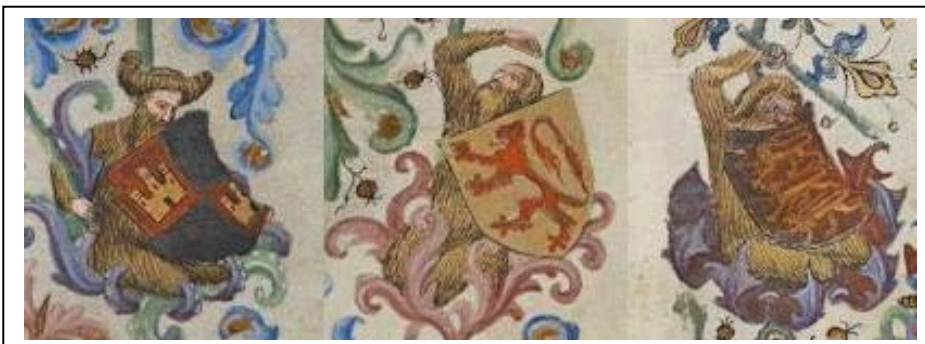
Figuur 4 Wildeman als schilddrager in de kroniek van Jean Froissart 1373