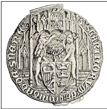
Figuur 2 Grootzegel uit 1422